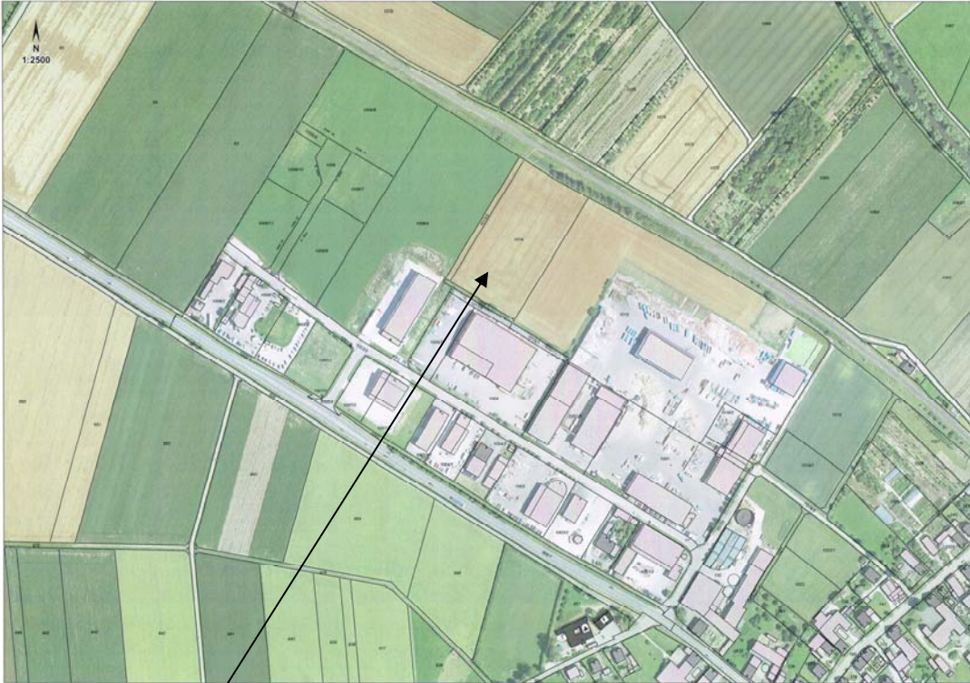
Gewerbegebiet „Enkinger Wegfeld 2. Änderung“ mit Bebauungsstand 2017, Darstellung unmaßstäblich

Das nachfolgend eingefügte aktuelle Luftbild zeigt den Entwicklungsstand der Gewerbeansiedlungen und die vorgesehene Neueinteilung der noch nicht bebauten Flächen.