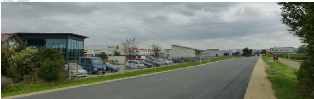
Gewerbegebiet „Enkinger Wegfeld“ von der B 25 aus gesehen, Aufnahmezeitpunkt: 08.09.2017

Aus raumordnerischer und landschaftsökologischer Sicht geht durch die Änderung des Bebauungsplans, hervorgerufen durch die Neuorientierung der Verkehrserschließung keine Umweltgefährdung, die das Vorhaben aus ökologischer Sicht als nicht realisierbar erscheinen lassen, aus. Der Umweltbericht beschränkt sich bei der Untersuchung der betroffenen Schutzgüter rein auf die Änderungsbereiche. Nach der Feststellung, dass keines der Schutzgüter durch die Planänderung beeinträchtigt wird, entfällt für die 2. Änderung des Bebauungsplans „Enkinger Wegfeld“ die Behandlung der Eingriffsregelung.