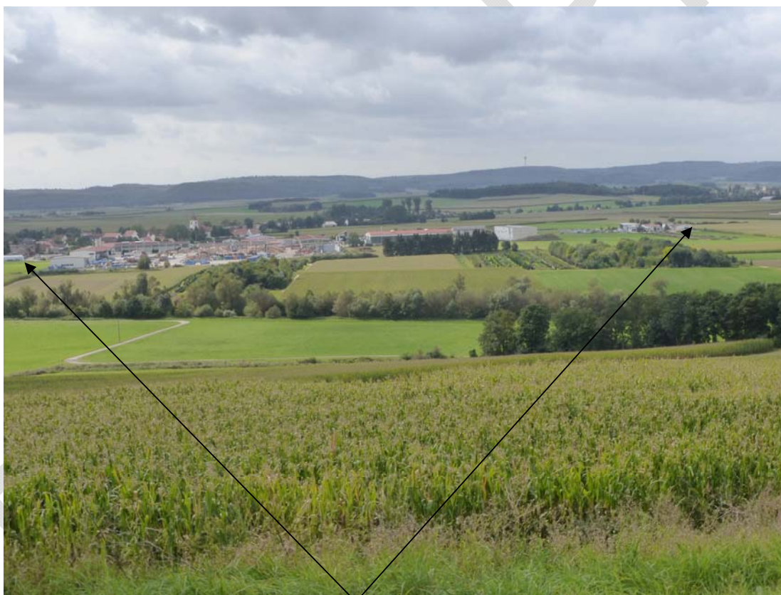
Blick auf das Gewerbegebiet „Enkinger Wegfeld“ vom Abhang des Hahnenbergs aus, Aufnahme-tag: 08.09.2017

Im Bereich des Planungsgebiets sind bislang keine Altlastenverdachtsflächen bekannt.